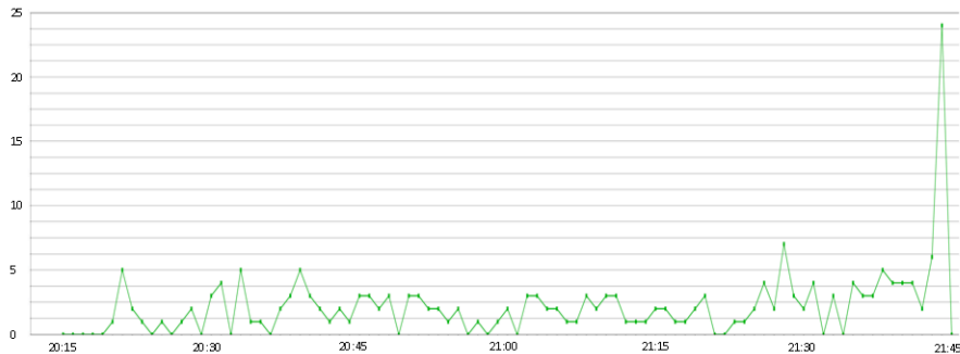
Abb. 2. Zeitliches Verlaufsdiagramm von Tweets aus der Kategorie Kritik

Der zeitliche Verlauf der Kritik-Tweets kann gut erklärt werden: In den ersten vier Minuten der Sendezeit wird der Rezipient in die Handlung eingeführt, der Tatort bietet hier noch keine Möglichkeit Kritik zu üben. Die wenig originelle Hinführung zum ersten Mord in der fünften Minute entlockt dann auch den Zuschauern erste kritische Äußerungen. Der Anstieg an Kritik-Tweets ab 21:35 Uhr ist dadurch zu erklären, dass die Dramaturgie des Tatorts ihrem Ende entgegen läuft. Letzte Unklarheiten werden erzählerisch beseitigt und die Geschichte ist dem Zuschauer nun als Ganzes zugänglich. Kritische Bewertungen der Folge fallen so leichter. Das absolute Maximum um 21:44 Uhr, also in der letzten Sendeminute, zeigt dementsprechend die abschließende Kritik der User auf.